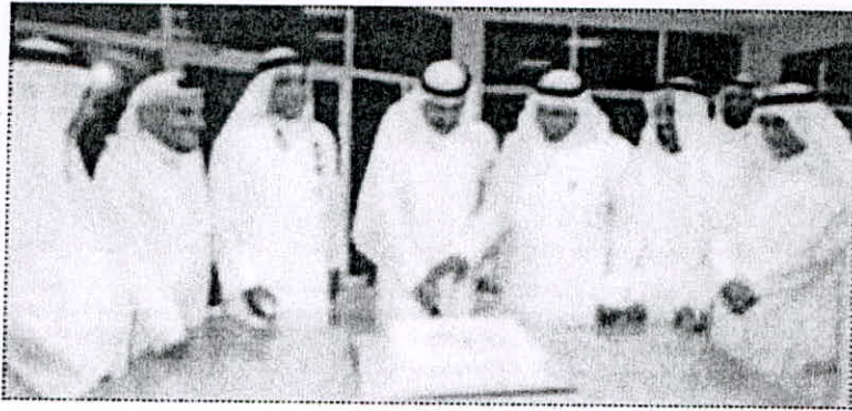
● قطع كمكة الاحتفال