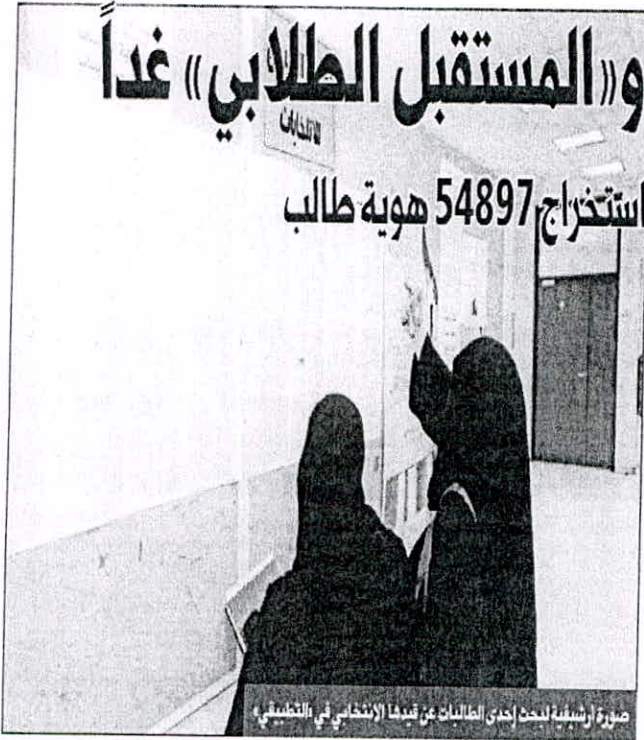
صورة لشباب لجنة إحدى الكليات من قاعة الانتخاب في التطبيقية

البريكي ـ الجريدة : 13 لجنة طلابية في الانتخابات... واستخراج 54897 هوية طالب